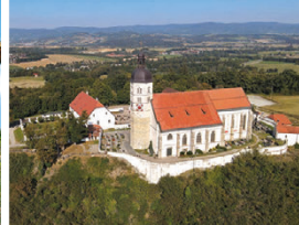
v.l.: KulturForum Oberalteich, Dreschermuseum Fröschlhof, Wallfahrtskirche Bogenberg