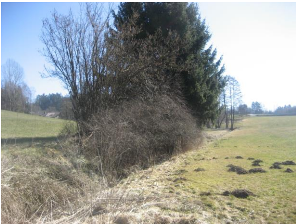
Abbildung 7: Blick von der nordwestlichen Grundstücksecke nach Südosten (Bach mit vorh. Gehölzen am rechtsseitigen Ufer)