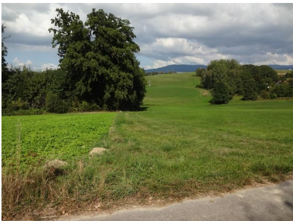
Abbildung 4: Blick von der Südwestecke auf die (rechts) geplante PV-Fläche; im Vordergrund der Anwandweg oberhalb/nördlich der A 3