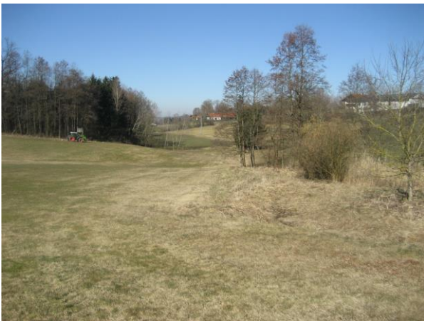
Abbildung 6: Blick von der nordöstlichen Grundstücksecke nach Westen auf die geplante Ausgleichsfläche (im Vordergrund rechts die Ökokatasterfläche)