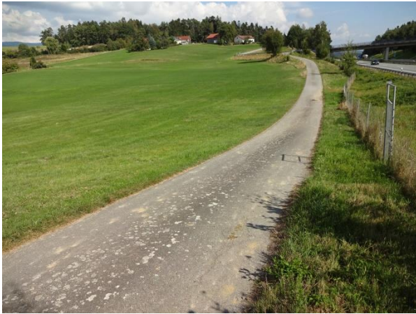
Abbildung 5: Blick vom Anwandweg nach Osten auf die ca. bis zur Bildmitte geplante PV-Anlage