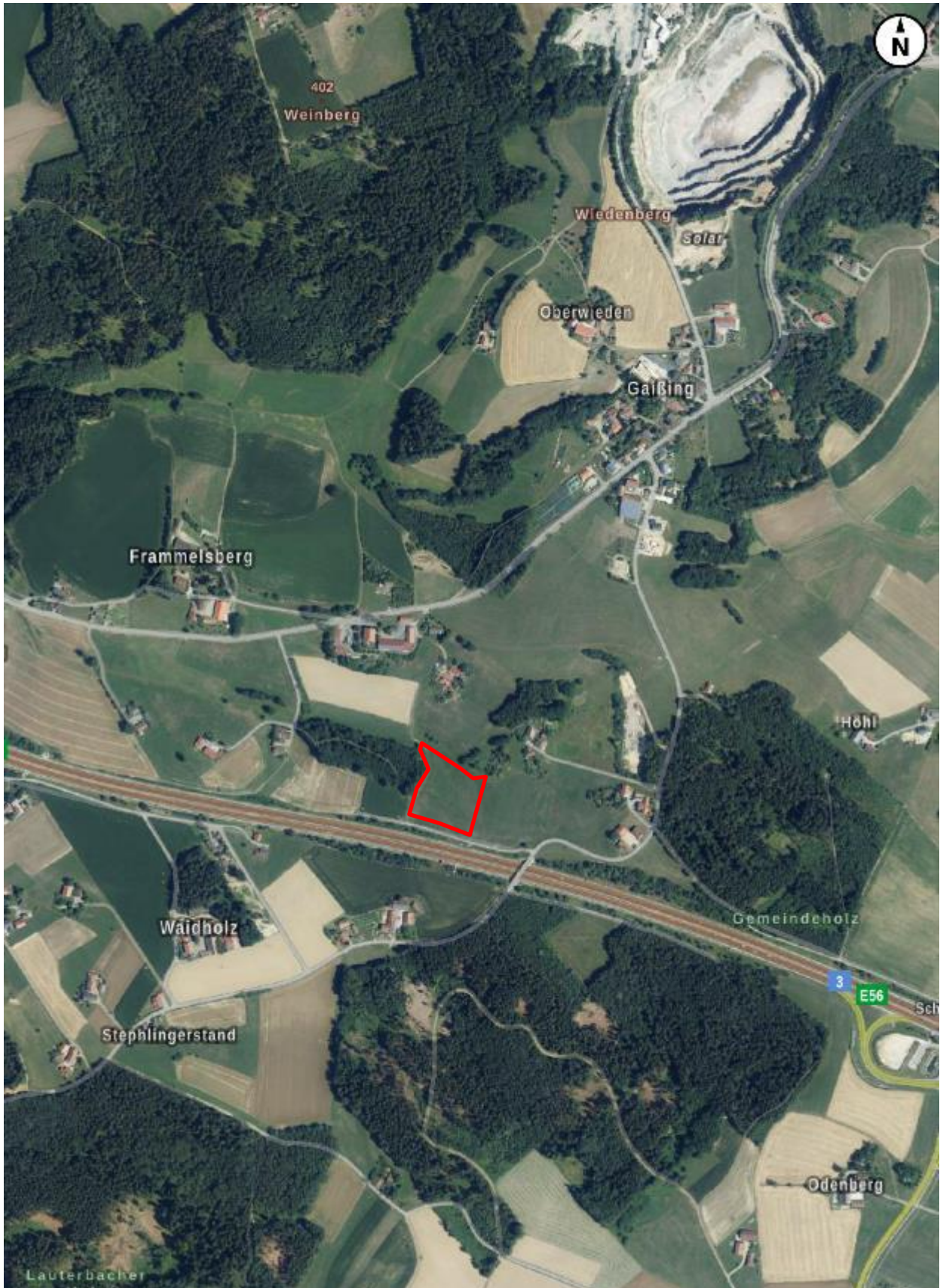
Abbildung 9: Luftbildausschnitt aus dem BayernAtlas vom 05.09.2020 – Maßstab ca. 1:5.000