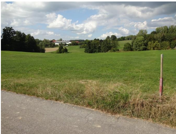
Abbildung 3: Blick von der Südostecke nach Norden auf die geplante PV-Fläche