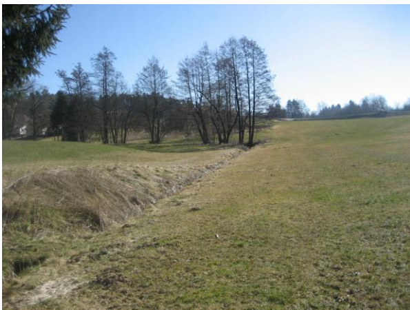
Abbildung 8: Blick von der nordwestlichen Grundstücksecke entlang des Baches nach Südosten