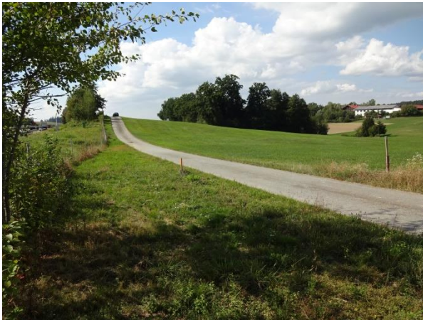
Abbildung 2: Blick von der Südostecke in Richtung Westen auf die auf dem Wiesenhang, vor dem Waldstück geplante PV-Fläche; am westl. Bildrand die A 3 in Richtung Regensburg

Das Planungsgebiet liegt im Ortsteil Waidholz der Stadt Bogen. Die Freiflächen-Photovoltaikanlage entsteht auf einer nach Norden und Osten hin geneigten Grünlandfläche und liegt nördlich der Bundesautobahn A 3. Westlich grenzen eine Acker- und eine Mischwaldfläche an. Die im Norden ausgewiesene Ausgleichsfläche befindet sich in der Talniederung eines Zuflusses zum Degernbach und grenzt mit ihrer Nordgrenze unmittelbar an das namenlose Fließgewässer 3. Ordnung. Ein im Nordosten angrenzendes Feuchtbiotop ist als Ökokatasterfläche erfasst. Im Osten schließen weiter Acker- bzw. Wiesenflächen an.