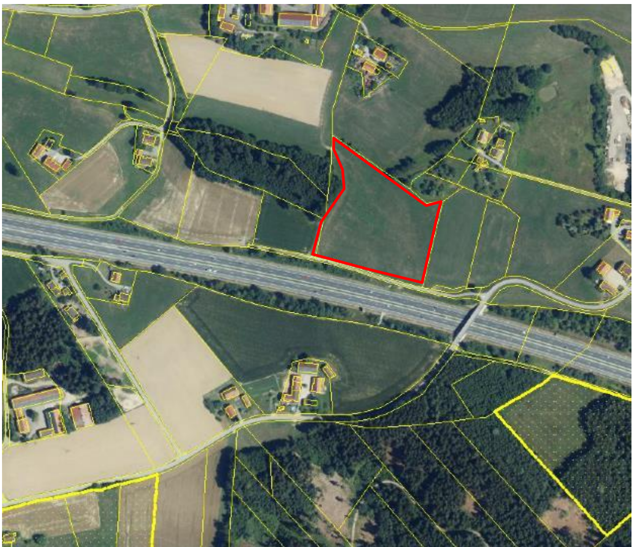
Abbildung 6: Luftbildauschnitt aus dem BayernAtlas vom 25.07.2020 – Maßstab ca. 1:5.000

Das Planungsgebiet mit einer Fläche von ca. 1,75 ha liegt im Ortsteil Waidholz der Stadt Bogen südlich der Bundesautobahn A 3. Der Geltungsbereich umfasst einen Teil der Fl. Nr. 1626 der Gmkg. Degernbach.